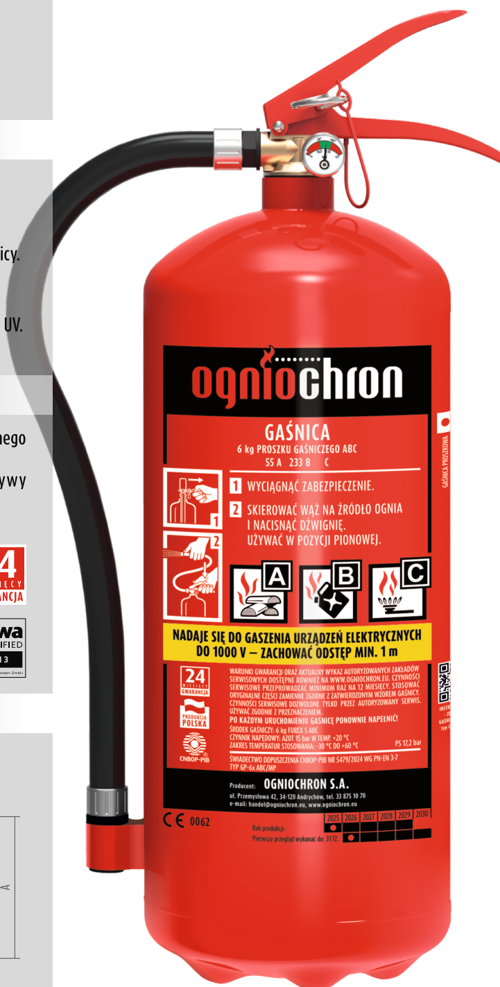
Zdjęcie ma charakter poglądowy.