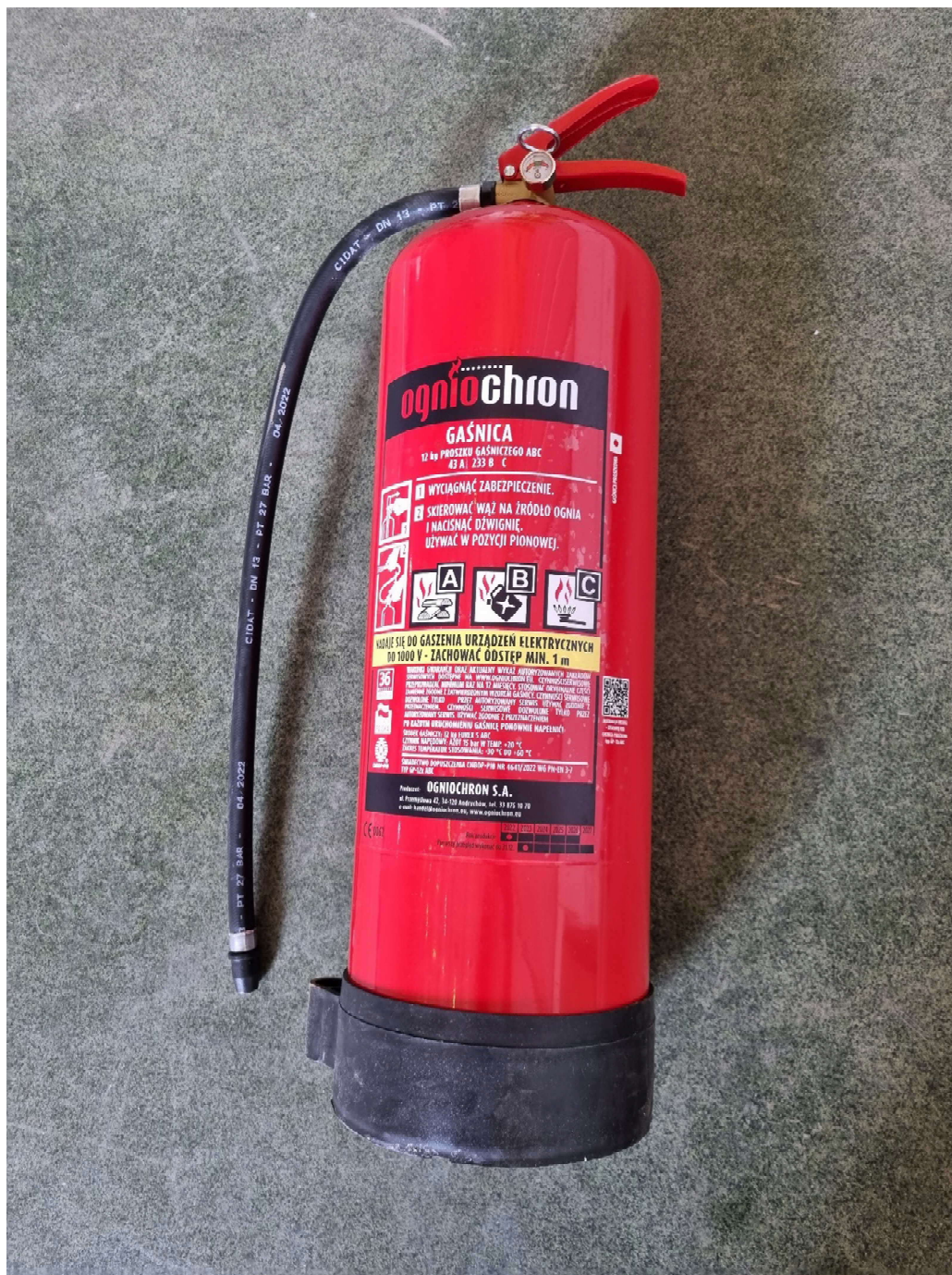
Fot. 1: Gaśnica proszkowa przewoźna GP-12x ABC

Na zlecenie przedsiębiorstwa KZWM Ogniochron S.A. z dnia 30.05.2022 r. w Laboratorium Wysokich Napięć Instytutu Energetyki przeprowadzono badania gaśnicy proszkowej przewoźnej typu GP-12x ABC (Fot. 1), zawierających proszek gaśniczy FUREX S ABC.