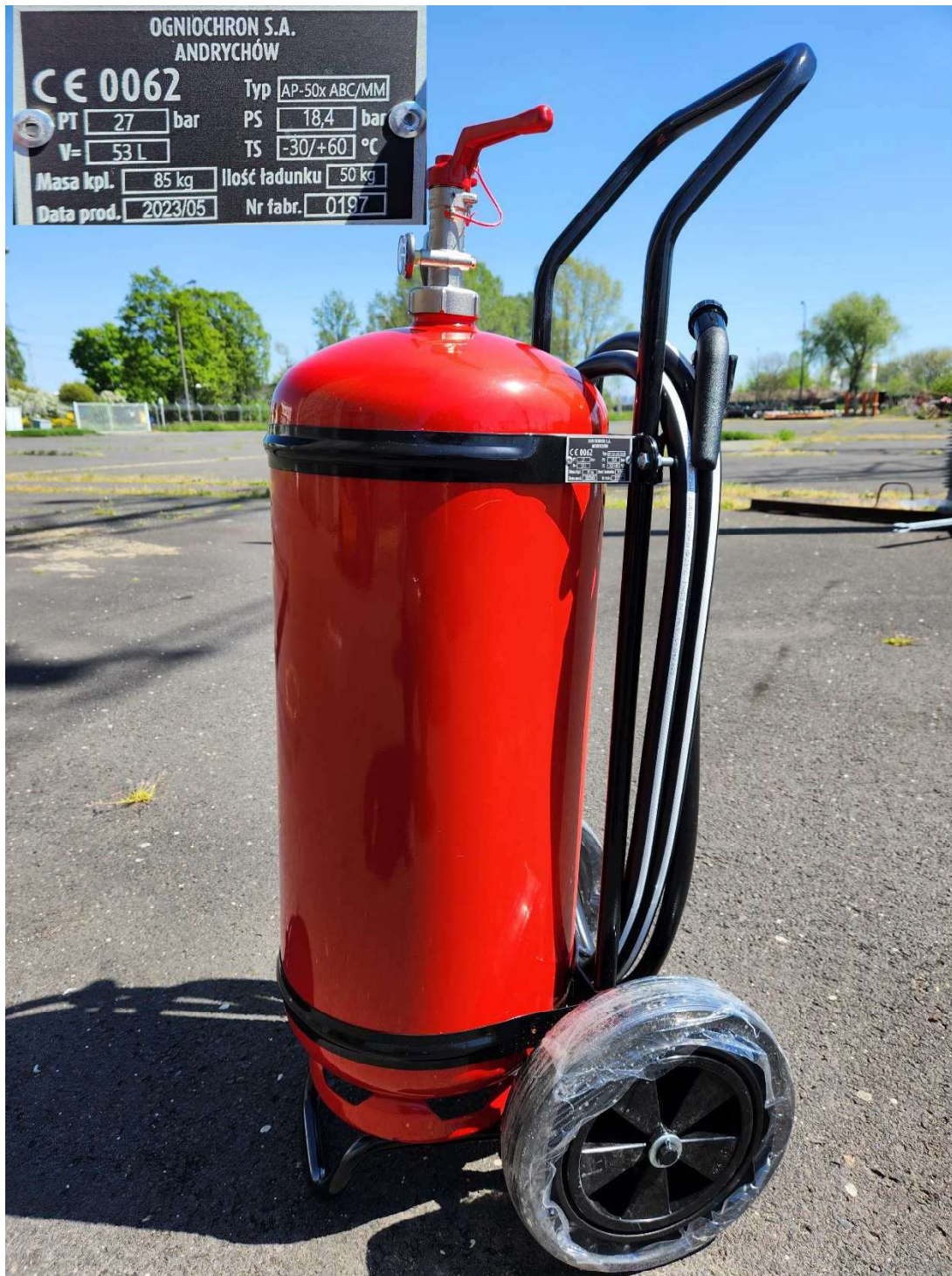
Fot. 1: Gaśnica proszkowa przewoźna AP-50x-ABC

Na zlecenie przedsiębiorstwa KZWM Ogniochron S.A. z dnia 11.05.2023 r. w Laboratorium Wysokich Napięć Instytutu Energetyki przeprowadzono badania gaśnicy proszkowej przewoźnej typu AP-50x-ABC (Fot. 1), zawierających proszek gaśniczy FUREX S ABC.